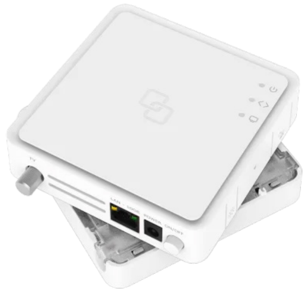
ONT: Optical Network Terminal.

Der Ausbau geht weiter: Im gesamten Stadtgebiet sind noch Tiefbaumaßnahmen und das Stellen und Aufrüsten von Multifunktionsgehäusen erforderlich. Auch die Installationsarbeiten in den Gebäuden in anderen Stadtgebieten wird fortgesetzt. Alle Bewohnerinnen und Bewohner werden über die Arbeiten rechtzeitig informiert. Bitte achten Sie deshalb auf Aushänge im Haus und Post in Ihrem Briefkasten.